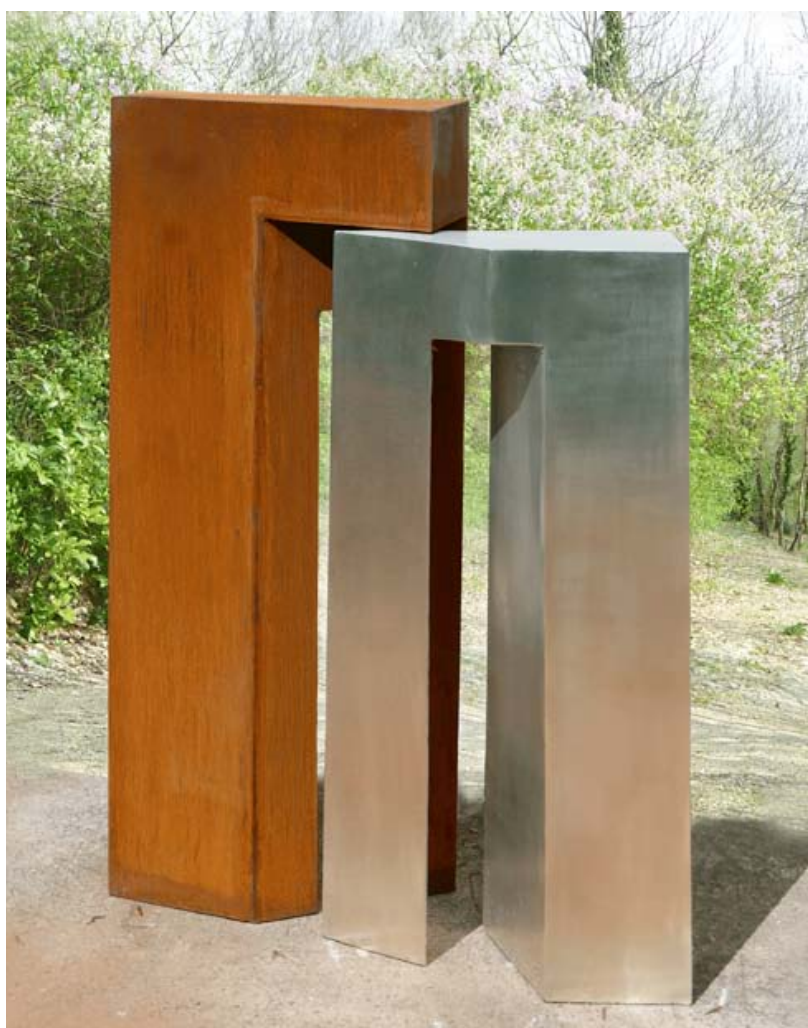
Fractale de lumière sculpture de Jean Suzanne, 2017, Acier corten et acier inoxydable

Selon les années, le nombre de peintres et de sculpteurs accueillis a pu varier (entre 15 et 40), comme celui des œuvres (entre 100 et 200), et celui des visiteurs (entre 3000 et 6000). Mais toujours des artistes professionnels reconnus, établis dans la région, au départ pour privilégier des ateliers situés à